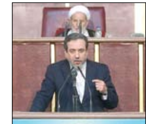
احترام به اجرای حق هسته‌ای و پذیرش حق کشور برای حرکت در مسیر تحقیق و توسعه، پیشرفت و تحقق غنی‌سازی صنعتی و استفاده از ماشین‌های نسل نو غنی‌سازی IR۶ و IR۸ برای رسیدن به اهداف صنعتی تا میزان یک میلیون سو ظرف ۱۵ سال بوده که در این توافق به آن دست پیدا کرده‌ایم. عراقچی دستاوردهای توافق هسته‌ای را این‌طور تبیین کرد: مهم‌ترین دستاوردهای ما در طول این مذاکرات، پذیرش حق

۱ یک عضو ارشد تیم مذاکره‌کننده هسته‌ای گفت: عده‌ای پذیرش قوانین بین‌المللی را پذیرش محدودیت تحمیلی دشمنان تفسیر می‌کنند که این موضوع بدون پشتوانه حقوقی و سیاسی است. ۲ به گزارش ایسنا، دکتر سید عباس عراقچی، معاون وزیر امور خارجه ایران که به عنوان میهمان ویژه در جلسه سوم هجدهمین اجلاس هیئت‌مجلس خبرگان رهبری سخنرانی می‌کرد، با تشریح پیشینه مذاکرات هسته‌ای در ۱۲ سال گذشته به عنوان یک مسأله ملی، ضمن بیان زبانه‌های طرف مذاکره‌کننده از تلاش‌های جمهوری اسلامی برای احقاق حق ملت و نپذیرفتن خواسته‌های نابه‌حق کشورهای غربی ۵+۱ سخن گفت و افزود: ما در مذاکرات با دست پر در ابعاد مختلف فنی، حقوقی، سیاسی و پشتیبانی معظم‌مهری و مردم‌مقاوم کشورمان ۳ وارد شدیم و همین امر موجب تحقق اقتدار نظام ما شد. ۴ او از دستاوردهای مذاکرات و توافق هسته‌ای گفت و افزود: امروز شاهد اقتدار جمهوری اسلامی در منطقه و جهان هستیم و انبیا قدرت نه گفتن نظام مقابل قدرت‌های به ظاهر برتر دنیا هستیم. این عضو ارشد تیم مذاکره‌کننده هسته‌ای، ضمن تقدیر از نظرات کارشناسی شده و سازنده برخی منتقدان توافق هسته‌ای گفت: ما الحاق و الانصاف از برخی انتقادهای تشکیکی که می‌کنیم چرا که طرح انتقادات موجب شد ما با دقت نظر و حساسیت بیش‌تری مواضع خود را در مذاکرات مطرح کنیم و همین موجب تقویت قدرت ما در مذاکرات بود. در عین حال از طرح برخی نقدهای غیرمنصفانه که بیش‌تر جنبه لجبازی دارند آزرده خاطر هستیم. ۵ وی افزود: خواسته ما در مذاکرات